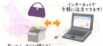
届いたら、すぐに使える！